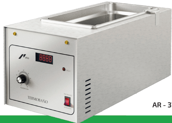
AR - 371D

Termobaños arsa® con una excelente uniformidad de temperatura. Diseño exclusivo con tanque de acero inoxidable construido en una sola pieza.