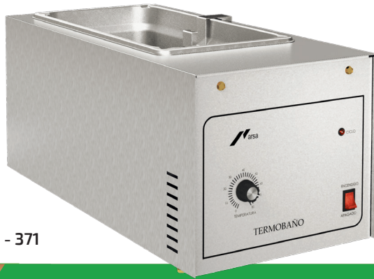
AR - 371